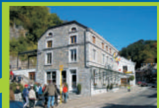
Maison du Tourisme van het Land van Ourthe-Amblève