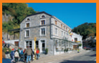
Maison du Tourisme du Pays d'Ourthe-Amblève

Die Themenrouten führen durch das Land Ourthe-Amblève und laden zur Entdeckung der Natur, der Architektur und der Kultur unserer Region ein. Jede Strecke erklärt die Zwischenstopps, die Abstände und die GPS-Daten. Gute Fahrt!