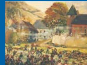
Sougne-Remouchamps tijdens de strijd, afkomstig van de collectie van het museum van het Land van Ourthe-Ambève in Comblain-au-Pont.

Bovenaan de bekende (fiets) helling van de 'Redoute' in Remouchamps, staat het monument opgericht ter herinnering aan de slag tussen de Oostenrijkers en het Franse Revolutionaire leger op 18 september 1794. Deze slag werd gewonnen door de Fransen, maar de naam Sprimont wordt genoemd op de Arc de Triomphe in Parijs.