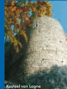
Kasteel van Logne

Het grootste gevecht vond plaats in 1521 toen keizer Karel V probeerde Logne met de grond gelijk te maken voordat 'Robert II de La Marck' teveel macht kreeg, want hij werd steeds belangrijker in de streek. Begeleid door een troep van 20.000 mannen en gewapend met 20 zware kanonnen, nam Karel V Logne in slechts 11 dagen. De ooit 'onneembare' vesting was niet bestemd tegen de nieuwe wapens zoals de kanonnen.