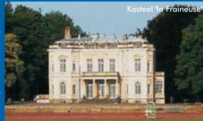
Kasteel 'la Fraineuse'

Dit verlengd verblijf vond plaats in het teken van angst voor de Kaiser. De angst voor een aanval deed hem meerdere malen verhuizen. Hij had vier residenties, waaronder de kastelen van 'Fraineuse' en 'Neubois'. 'Neubois' werd uitgerust met een ondergrondse schuilplaats om de Kaiser tegen luchtaanvallen te