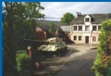
Tijger-tank voor het museum

Dit museum bevindt zich daar waar de Slag om de Ardennen plaatsvond. Het is opgedragen aan de 50 miljoen mannen, vrouwen en kinderen welke het leven verloren tijdens de Tweede Wereldoorlog. Authentieke audiovisuele documenten (17 dia's, meer dan 85 poppen met originele kleding), voertuigen, militair materiaal en wapens van toen en de tank "Koninklijke Tijger", uniek in België, de trots van de Duitse panzerdivisie.