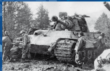
Tank 'Tigre' van het museum 'December 1944'